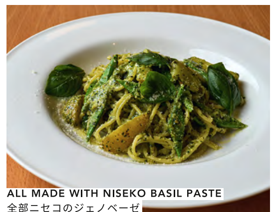
ALL MADE WITH NISEKO BASIL PASTE 全部ニセコのジェノベーゼ

All prices are inclusive of 10% VAT. 表示金額は、消費税10%込みの価格です。