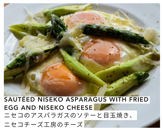
SAUTÉED NISEKO ASPARAGUS WITH FRIED EGG AND NISEKO CHEESE ニセコのアスパラガスのソテーと目玉焼き、ニセコチーズ工房のチーズ