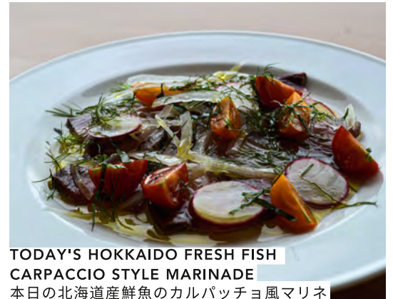
TODAY'S HOKKAIDO FRESH FISH CARPACCIO STYLE MARINADE 本日の北海道産鮮魚のカルパッチョ風マリネ