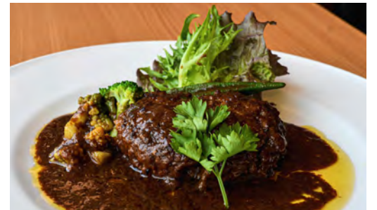
CHEF MOKA'S SPECIAL HOKKAIDO BEEF HAMBURGER STEAK WITH RED WINE SAUCE モカシェフ特製北海道産牛肉ハンバーグ 赤ワインソース