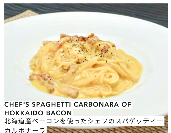
CHEF'S SPAGHETTI CARBONARA OF HOKKAIDO BACON 北海道産ベーコンを使ったシェフのスパゲッティーカルボナーラ