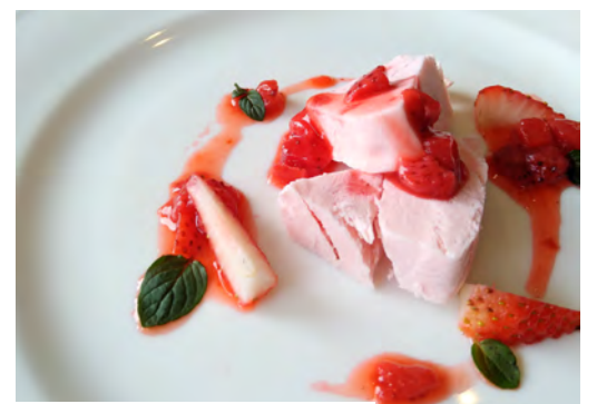
TODAY'S FRUIT SEMIFREDDO 本日の果物のセミフレッド

All prices are inclusive of 10% VAT. 表示金額は、消費税10%込みの価格です。