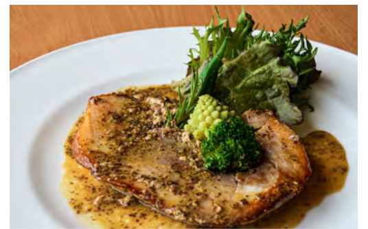
ITALIAN STYLE ROASTED HOKKAIDO PORK BELLY 北海道産豚バラのイタリア風ロースト

CHEF MOKA'S SPECIAL HOKKAIDO BEEF HAMBURGER STEAK WITH RED WINE SAUCE ¥3250