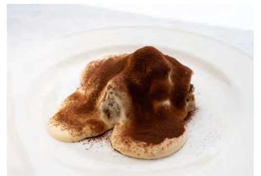
CHEF'S TIRAMISU シェフ特製 ティラミス