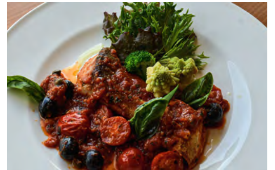
GRILLED HOKKAIDO YELLOWTAIL WITH SALSA PUTTANESCA 北海道産天然ブリのグリル プッタネスカソース

ITALIAN STYLE ROASTED HOKKAIDO PORK BELLY ¥3200